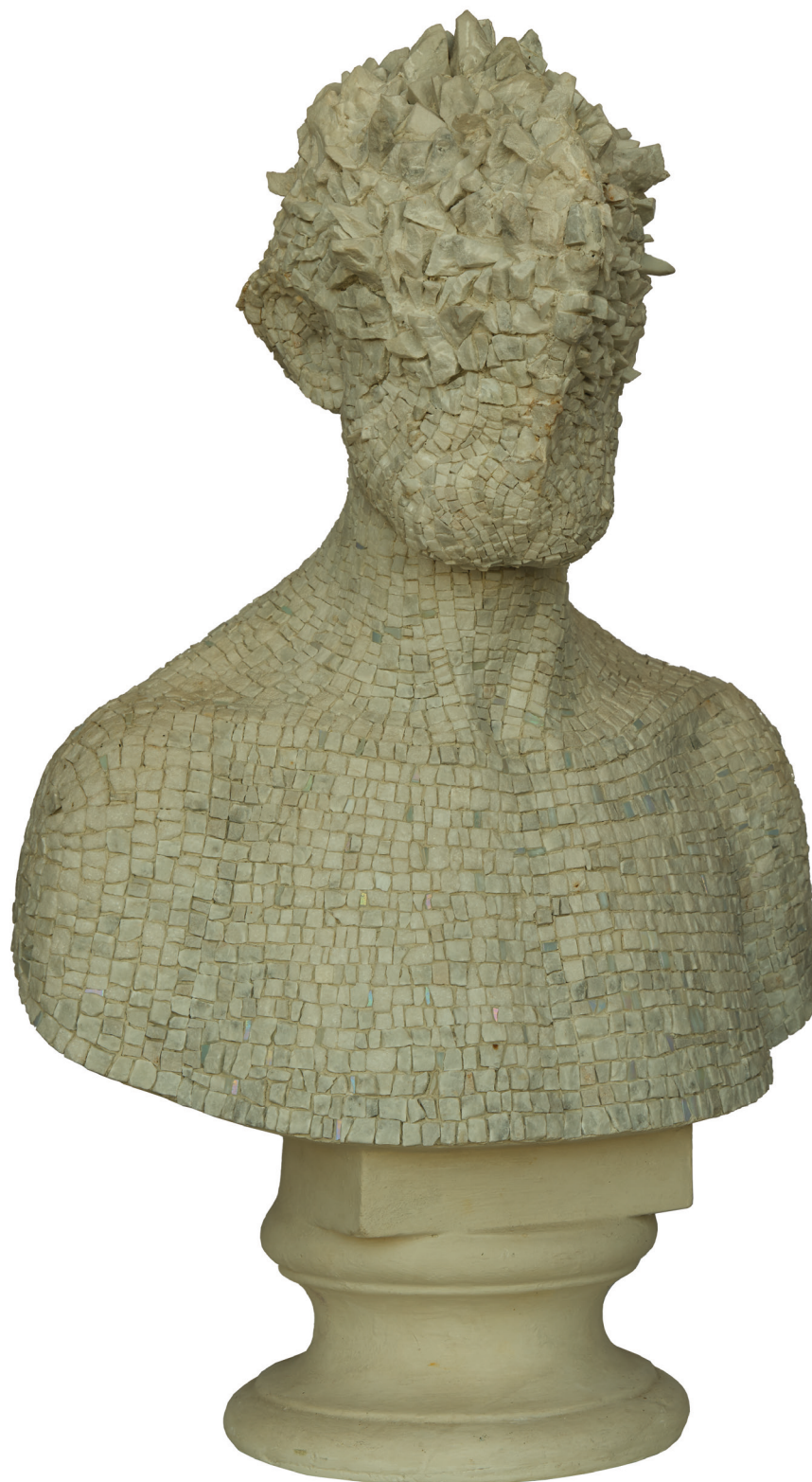
Nicola Samori, realizzazione musiva del Gruppo Mosaicisti Ravenna, Marco Santi, Ritratto neoclassico , 2017, mosaico in marmo