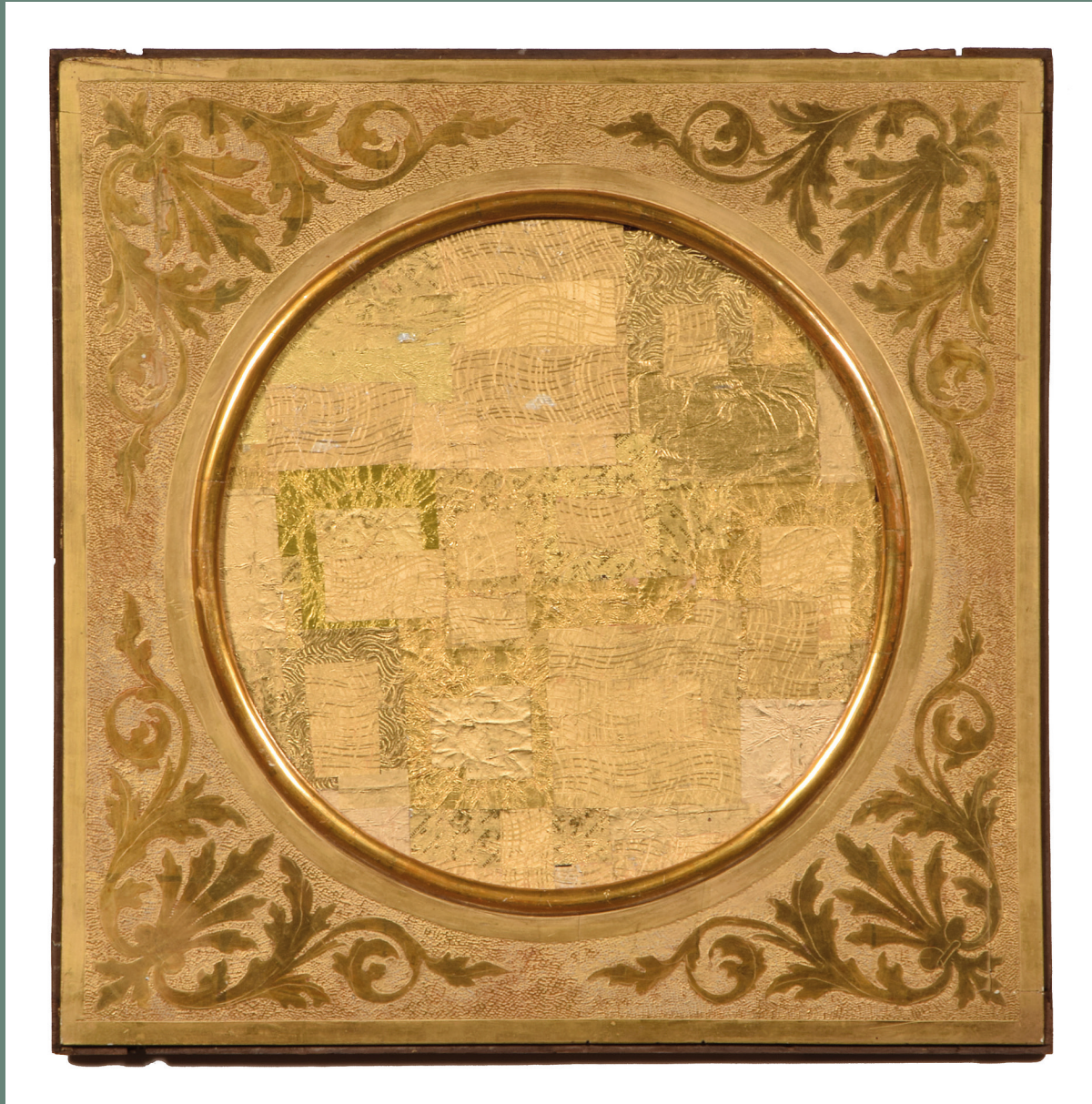
Flavio Favelli, Gold Zaire , 2021, collage di carte di cioccolatini