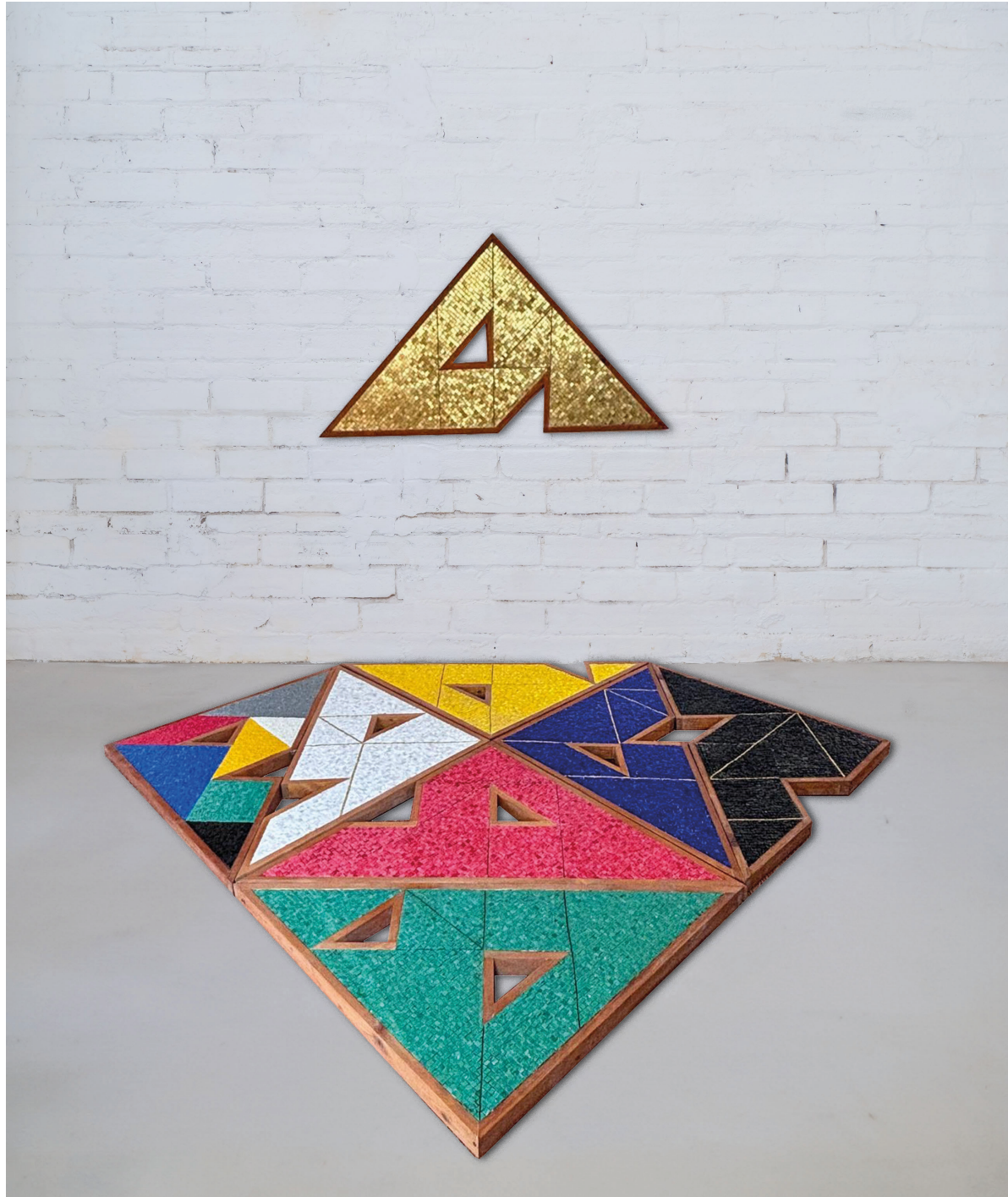
Antonio Passa, realizzazione musiva di Luciana Notturmi, installazione di 8 mosaici (Verde: Re Melchiorre; rosso: L'angelo del bene; bianco: Re Baldassarre; nero: Disegno ravennate; blu: L'angelo del male; giallo: L'agnello di Dio; sette colori: Greca ravennate III; oro: S. Apollinare Nuovo)