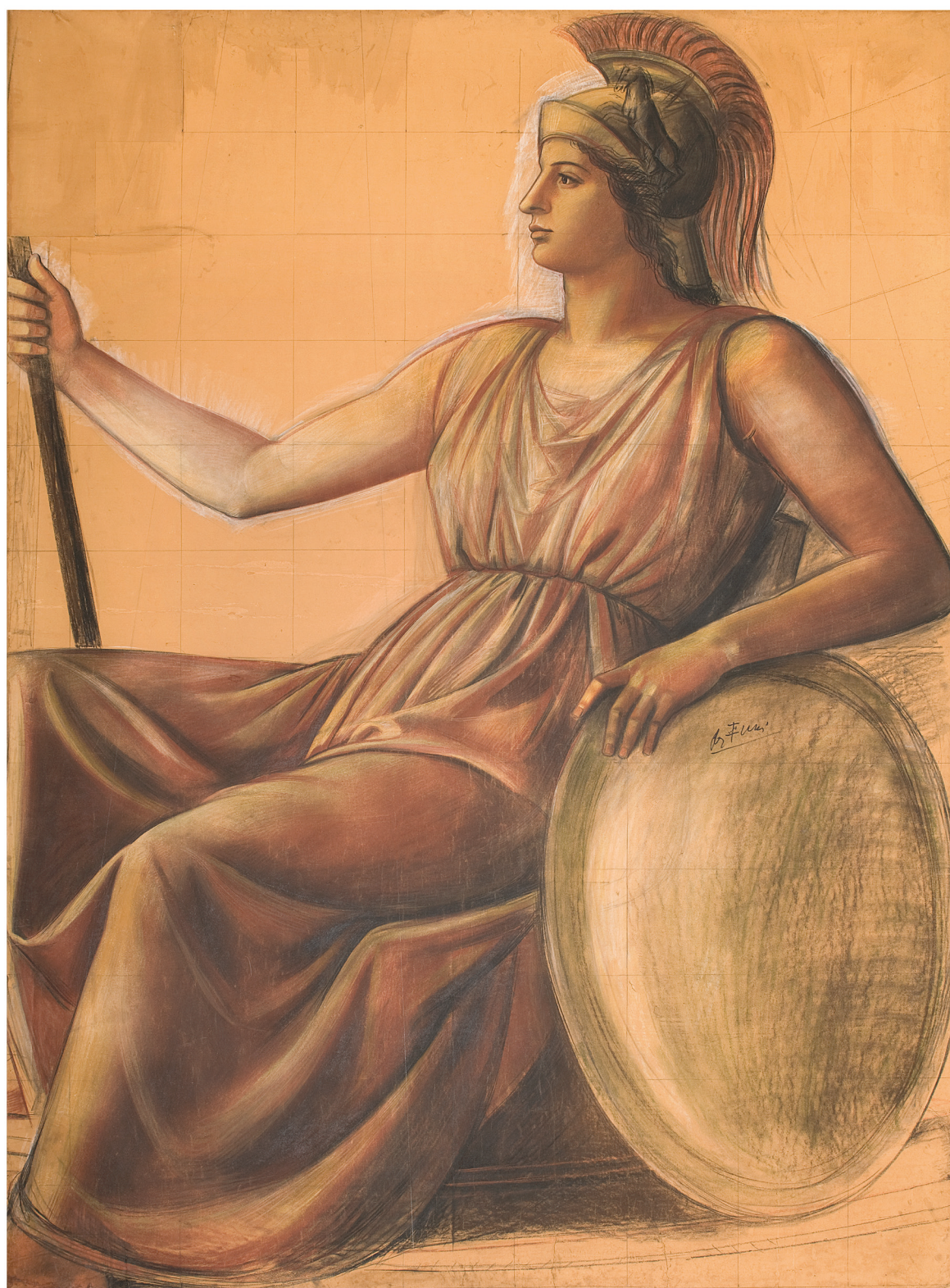
Achille Funi, Minerva , 1940, carboncino e tempera su cartone intelato