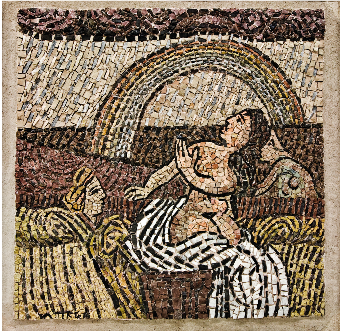
José Ortega, realizzazione musiva della Cooperativa Mosaicisti dell'Accademia di Belle Arti di Ravenna, Arcobaleno , 1978