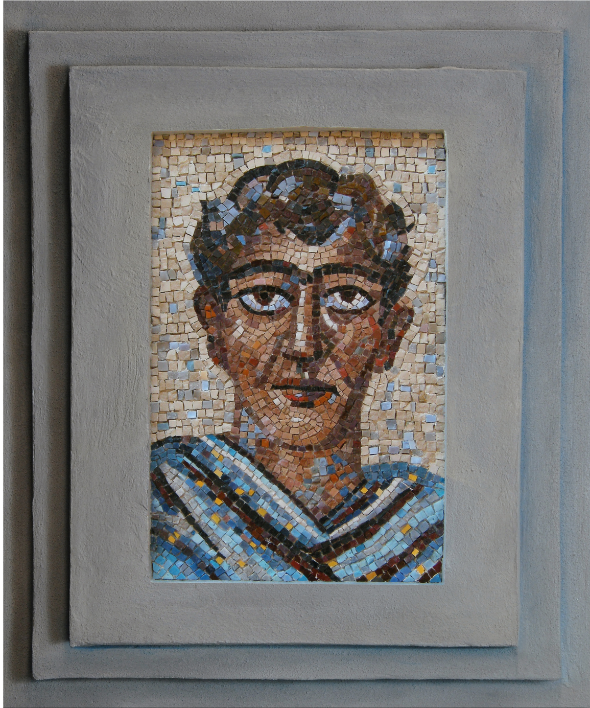
Gino Severini, Testa Maschile , copia dall'originale del 1938, mosaico