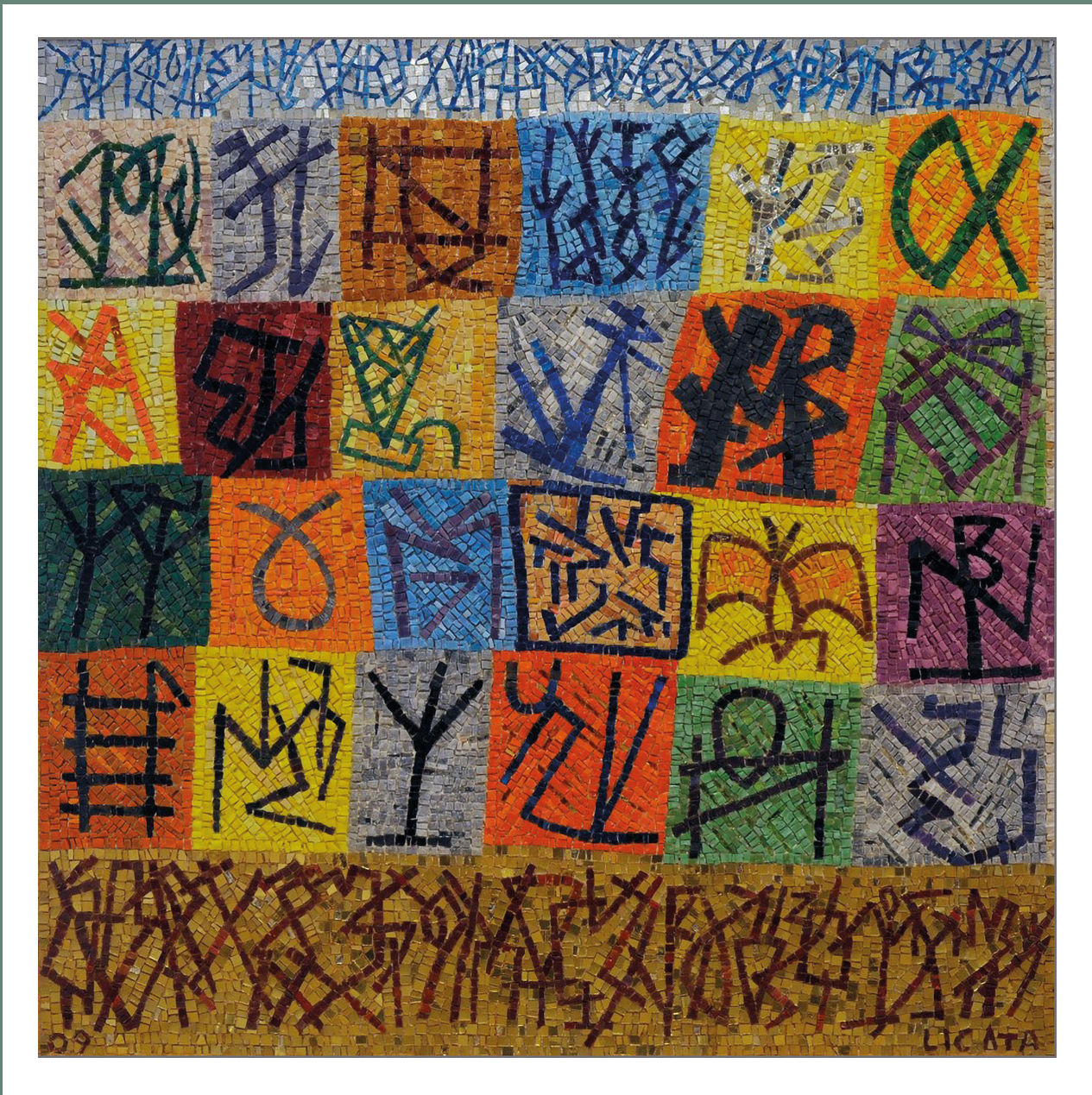
Riccardo Licata, realizzazione musiva di Marco Santi, Senza titolo , 2009