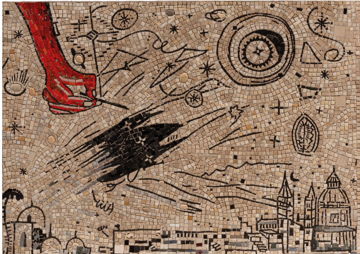
Enzo Cucchi, realizzazione musiva del Laboratorio Saccardi, Cagliari, 2014, mosaico