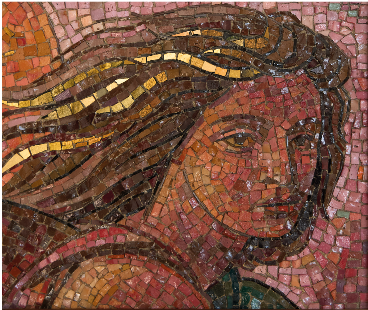
Achile Funi, realizzazione musiva di Giuseppe Saliotti, Angelo , 1939, mosaico